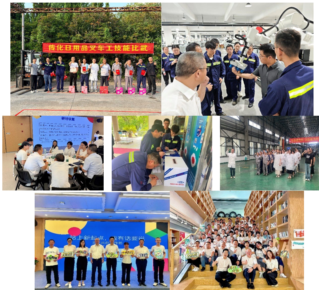
图 2-5-2 传化日用品员工活动