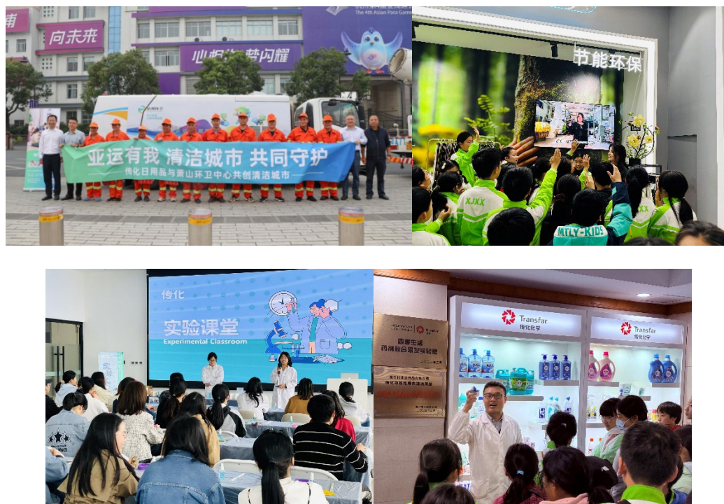
图 2-5-1 传化日用品公益活动