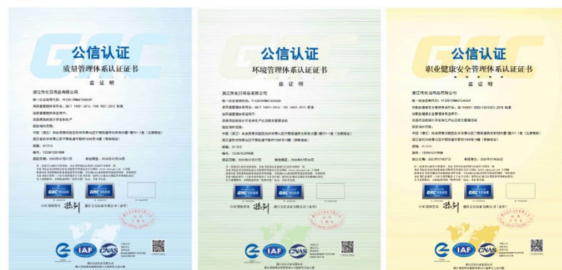
图 1-1-2 公司荣誉展示

参与起草制订“浙江制造”团体标准 T/ZZB 2816—2022《手洗餐具用洗涤剂》、GB/T 21241-2022《卫生洁具清洗剂》、QB/T 5782-2023《洗衣机槽清洗剂 过氧化物型》、T/ZZB 2291-2021《泡沫抑菌洗手液》、T/ZZB 2698-2022《抑菌型洗衣皂》、T/CHCIA 003-2022《日化行业低碳产品评价方法及要求 清洁护理产品》、T/CSTE 0187-2022《绿色低碳产品评价要求 洗涤用品 第1部分：液体洗涤剂》。