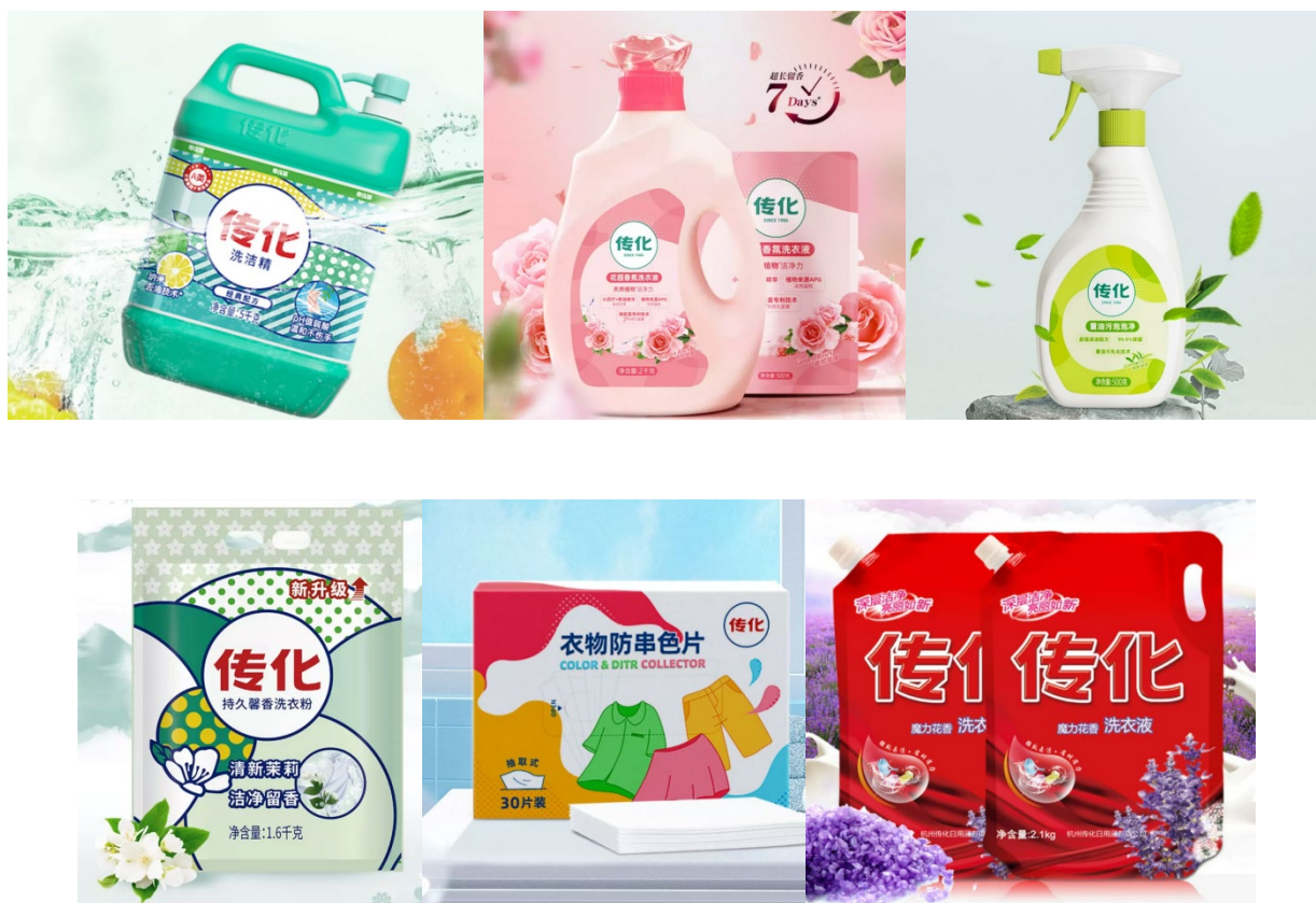
图 1-1-1 产品介绍

为了满足长江三角洲地区客户发展需求，公司注册地址位于中国（浙江）自由贸易试验区杭州萧山区宁围街道传化日用品科创大厦 1 幢 701-1 室，分支机构经营场所设在浙江省杭州市萧山区宁围街道宁新村 1008 号 10 幢。充分借鉴欧美先进企业的成功经验，结合国内的生产经验，推行企业规模化生产，同时进一步完善服务体系，技术先进传化日用品科技一流品牌。同时公司为了方便快捷地服务各地区客户，在浙江、江苏、安徽、江西等地设立营销部，进一步完善服务体系，就近服务客户，从而不断提升传化日用品科技之服务质量。企业宗旨：为员工创造福利，为社会创造价值！